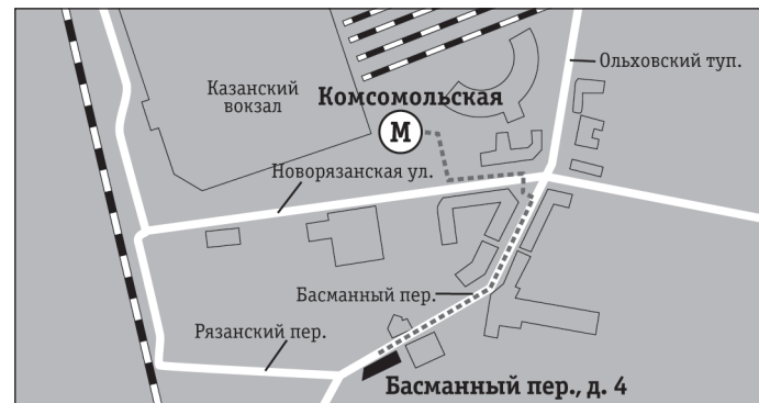
Басманный переулок, д. 4

Необходимо предварительно записаться по телефону: 8 (495) 150-54-92, добавочный 500. Доступна стирка личных вещей.