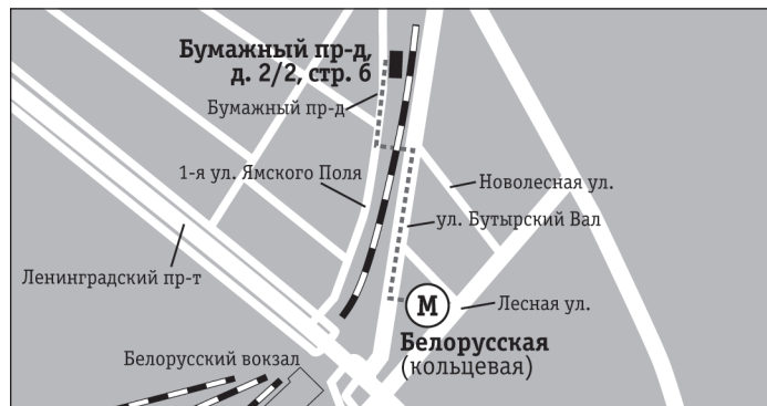
Бумажный проезд, д. 2/2, стр. 6

Необходимо предварительно зарегистрироваться у социального работника. Доступна стирка личных вещей.