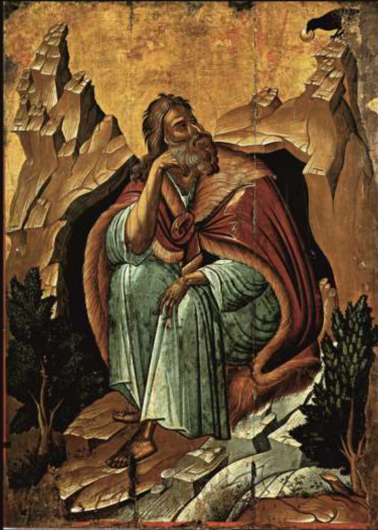
Илья Пророк. Греция. 17век. Материалы: темпера, дерево.

«Мы нашли Того, о Котором писал Моисей в законе и пророки, Иисуса...». (Ин. 1:45)