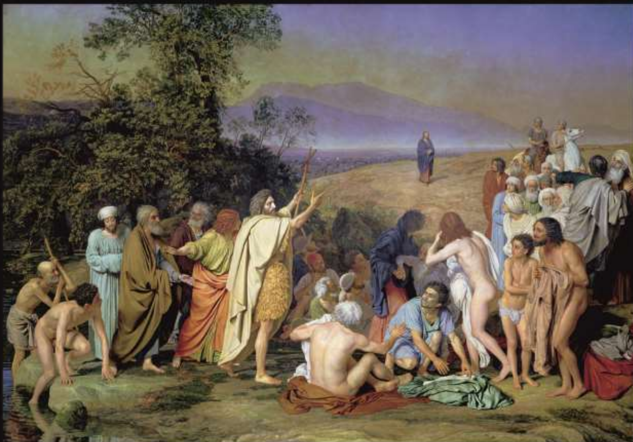
Явление Христа народу. 1836-1857 гг. Иванов А.А. Россия.

Пророчества донесли, что перед приходом Спасителя Бог пошлет какого-то пророка, который будет готовить человечество к Новому Закону. Этим пророком и был Иоанн. Он был строгим аскетом и много лет провел в пустыне. Когда пришло время Бог послал его на служение. Он явился в многолюдную Иудею и у реки Иордан начал проповедь. Иоанн обличал несправедливость, но главным его делом было обратить народ к покаянию – к осознанию своих ошибок и заблуждений. Его слово и пример были так могущественны, что вся страна выходила слушать его. Всех приходящих он крестил, т.е. опускал с головой в воду, за что его прозвали Крестителем. Это было знаком того, что отныне человек, признав все свои слабости, от души постарается больше не грешить. Он стал известен на всю страну, и люди стали помышлять, не он ли обещанный Спаситель.