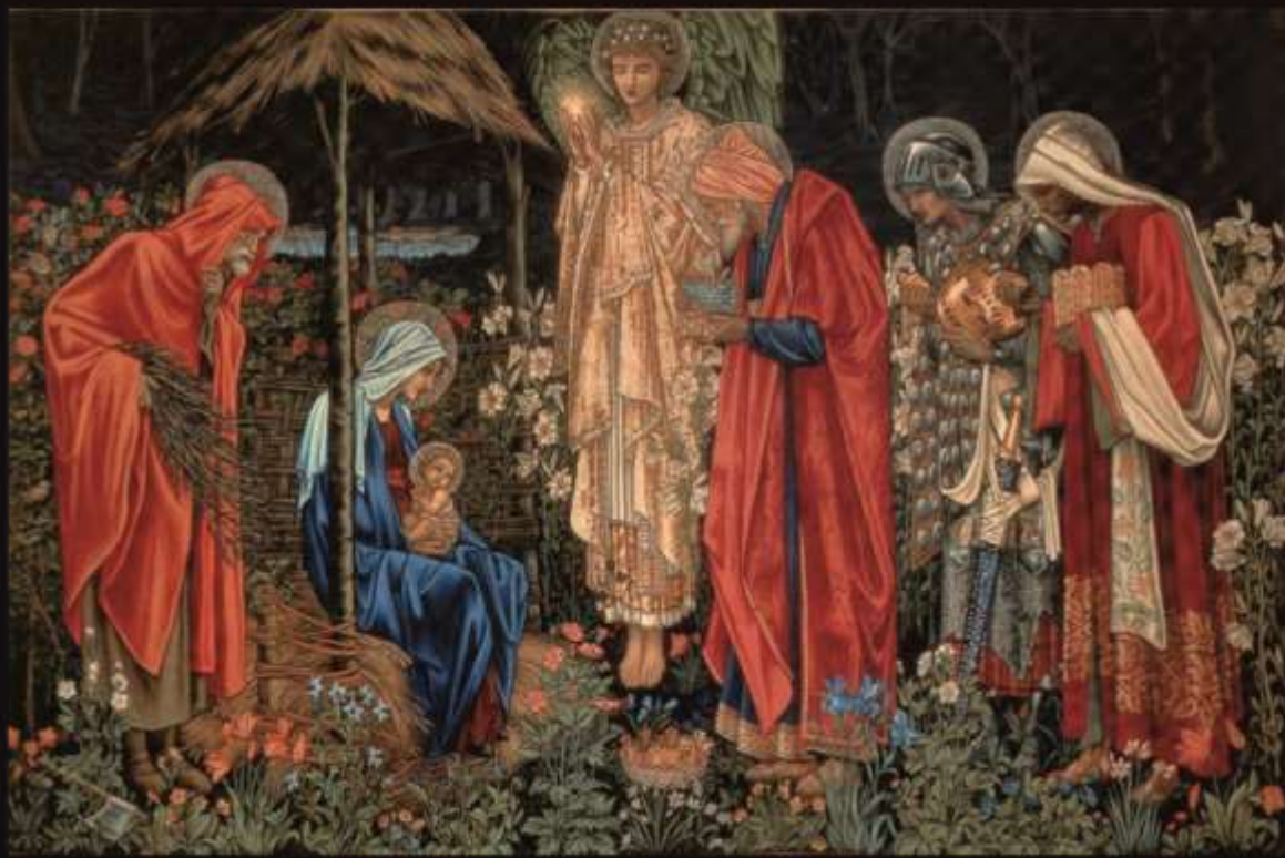
Поклонение волхвов. Эдвард Коли Бёрн-Джонс. Великобритания. 1850г. Шпалера, вытканная в мастерской У. Морриса. Эрмитаж

«Увидев звезду, волхвы возрадовались радостью весьма великою, и, войдя в дом, увидели Младенца с Мариею, Матерью Его, и, пав, поклонились Ему; и, открыв сокровища свои, принесли Ему дары: золото, ладан и смирну». (Св. Евангелие от Матфея)