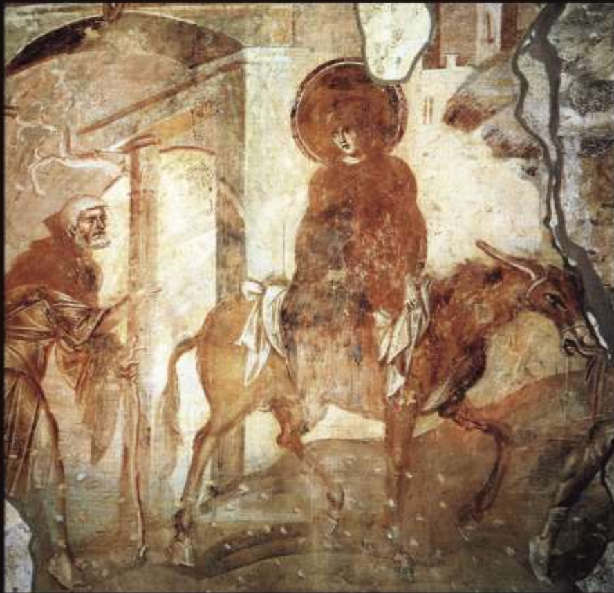
Путешествие в Вифлеем, Византия; VIII в. Италия. Кастельсеприо. Фреска в церкви Санта-Мария форис portas.

«И пошли все записываться, каждый в свой город. Пошел также и Иосиф из Галилеи, из города Назарета, в Иудею, в город Давидов, называемый Вифлеем, потому что он был из дома и рода Давидова». (Св. Евангелие от Луки 2:3-5)