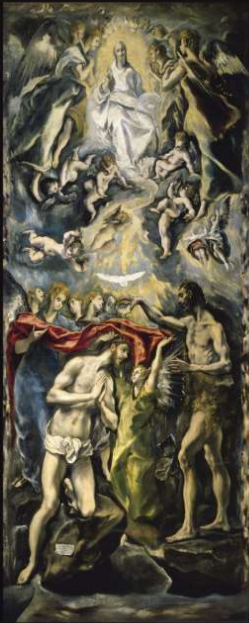
Крещение Иисуса Христа. 1600 г. Эль Греко. Испания. Мадрид.