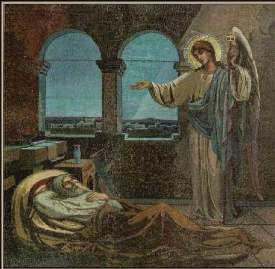
Сон Иосифа перед бегством в Египет. Отмар Валериан. Россия. 1900г. Санкт-Петербург. Мозаика храма Спас-на-Крови.

«Ангел Господень явился ему во сне и сказал: Иосиф, сын Давидов! не бойся принять Марию, жену твою, ибо родившееся в Ней есть от Духа Святаго». (Св. Евангелие от Матфея 1:20)