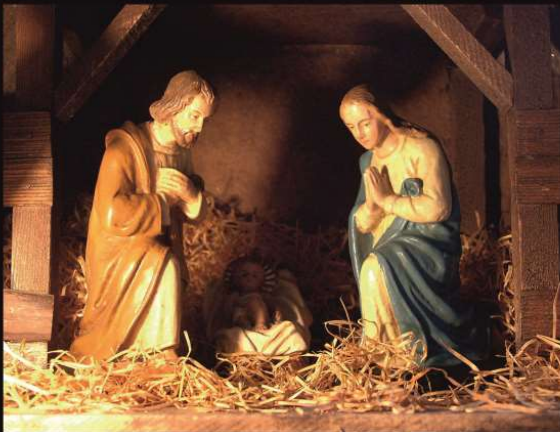
Рождественский вертеп XIX века в церкви Сан Никола алла Карита, Неаполь. Италия. Материалы: фарфор, дерево.

Не найдя места среди людей, Иосиф и Мария расположились в загоне для скота. Этот хлев был устроен в вертепе, то есть в небольшой пещере, какие в той местности используются пастухами и сегодня. Именно здесь, вдали от людского взора, в окружении мирных животных, родился Спаситель мира Иисус Христос. Молодая Дева-Матерь, спеленав, положила его в ясли – кормушку для скота, которая имела вид ящика, прикрепленного к стене.