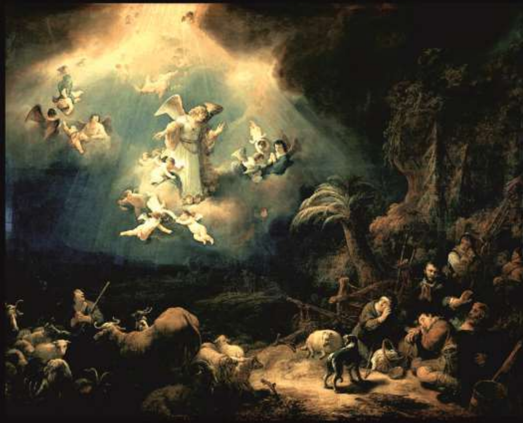
Ангел возвещает пастухам рождество. Голландский живописец Говерт Флинк. 1639 г. Материалы: холст, масло.

«И, поспешив, пастухи пришли и нашли Марию и Иосифа, и Младенца, лежащего в яслях. Увидев же, рассказали о том, что было возвещено им о Младенце Сем». (Св. Евангелие от Луки 2:16-17)