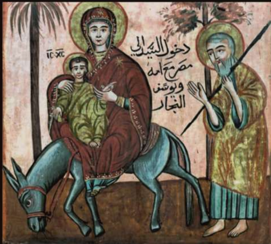
Пришествие в Египет. Фреска Коптской церкви.

«Ангел Господень является во сне Иосифу и говорит: встань, возьми Младенца и Матерь Его и беги в Египет, и будь там, доколе не скажу тебе, ибо Ирод хочет искать Младенца, чтобы погубить Его». (Св. Евангелие от Матфея 2:13-14)