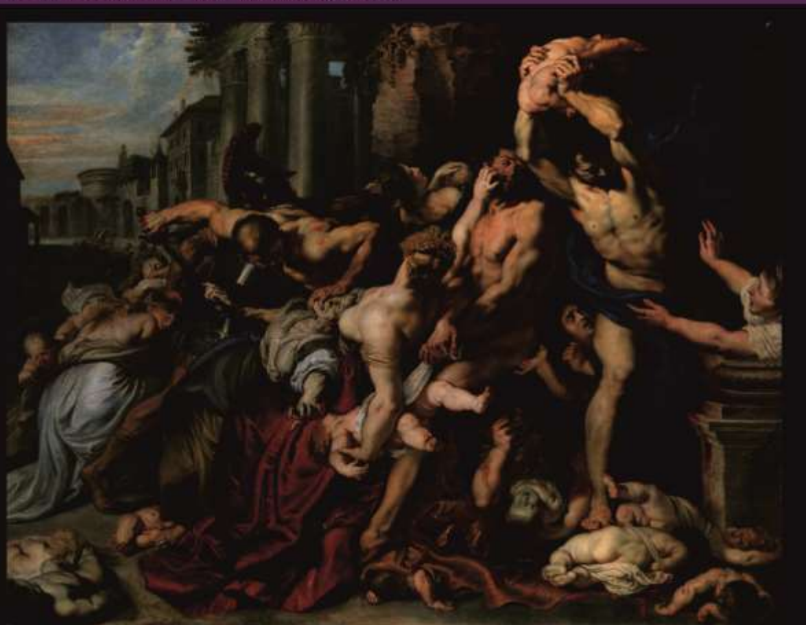
Избиение младенцев. 1610 г. Петер Пауль Рубенс - фламандский живописец.

Последние годы правления Ирода отмечены особой подозрительностью, мстительностью и жестокостью. Так, по доносу о измене он приказал казнить трех своих собственных сыновей. Услышав про Царя, Ирод испугался заговора с целью свержения его власти (а вместе с тем и власти Рима). Слухи в народе о Великом Царе могли помешать ему спокойно править. Волхвам было откровение – не возвращаться к Ироду, а идти другим путем. И они послушались. Когда Ирод осознал, что волхвы пренебрегли его повелением и не вернуться, он рассердился и направил в Вифлеем армию, дав повеление истребить всех младенцев младше двух лет. Было умерщвлено несколько тысяч невинных детей.