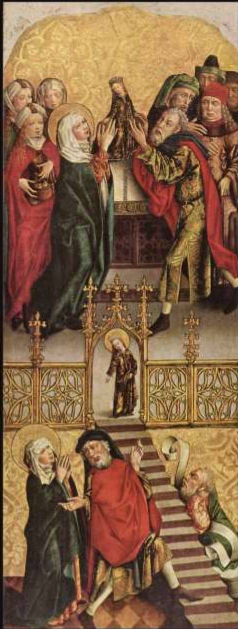
Введение Марии во храм. Германия. 1470гг.

«Вот, Дева во чреве примет и родит Сына». (Мф. 1:23)