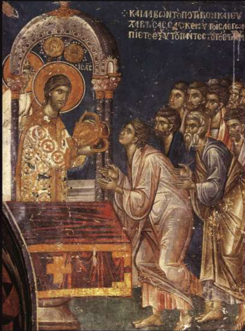
Евхаристия Византия XIV в. Греция. Салоники церковь. Николая Орфаноса. Фреска.

Рождество Христово – торжество не только для людей, но и для Бога: не только Бог сошел на землю, но и человечество, устав от бессмысленности и пустоты, созрело, чтобы впустить Его в свои ряды. Столько тысячелетий Он терпеливо стоял у дверей, ожидая, когда же Ему откроют. С тем же терпением стучит Он и в дверь каждого сердца. Но лишь от человека зависит, открыть или нет – впустить ли Его в свою жизнь или оставить вне, за ее пределами. Зато тот, кто готов и хочет видеть Бога в своей жизни, может соединиться с Ним не только образно, но и реально – через таинство Причащения, которое соединяет с Самим Богом. А уж для тех, в кого вошел Бог, этот праздник становится волшебным. Что невозможно тому, в ком по-настоящему родился Христос? Какие мечты неосуществимы для тех, кому помогает Владыка этого мира? Именно поэтому в праздник Рождества Богу загадывают желания – но только самые лучшие и светлые. Если уж Он не погнушался прийти в мир и стать одним из нас, неужели отвергнет и нашу маленькую просьбу?