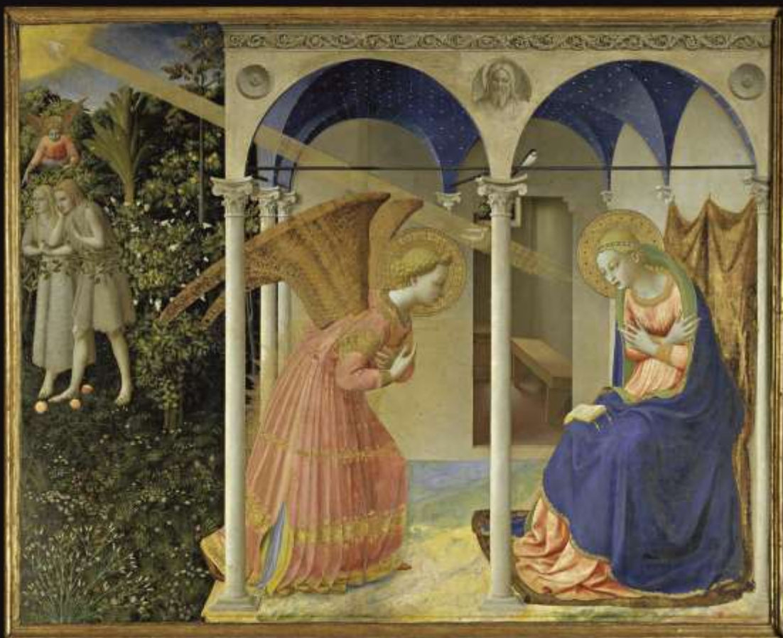
Благовещение. Фра Беато Анжелико. Итания. 1426г. Церковь Санто Доминго де Фьезоле во Флоренции. Материалы: дерево, темпера.

«И сказал Ей Ангел: не бойся, Мария, ибо Ты обрела благодать у Бога; и вот, зачнешь во чреве, и родишь Сына, и наречешь Ему имя: Иисус». (Лк. 1:30-31)