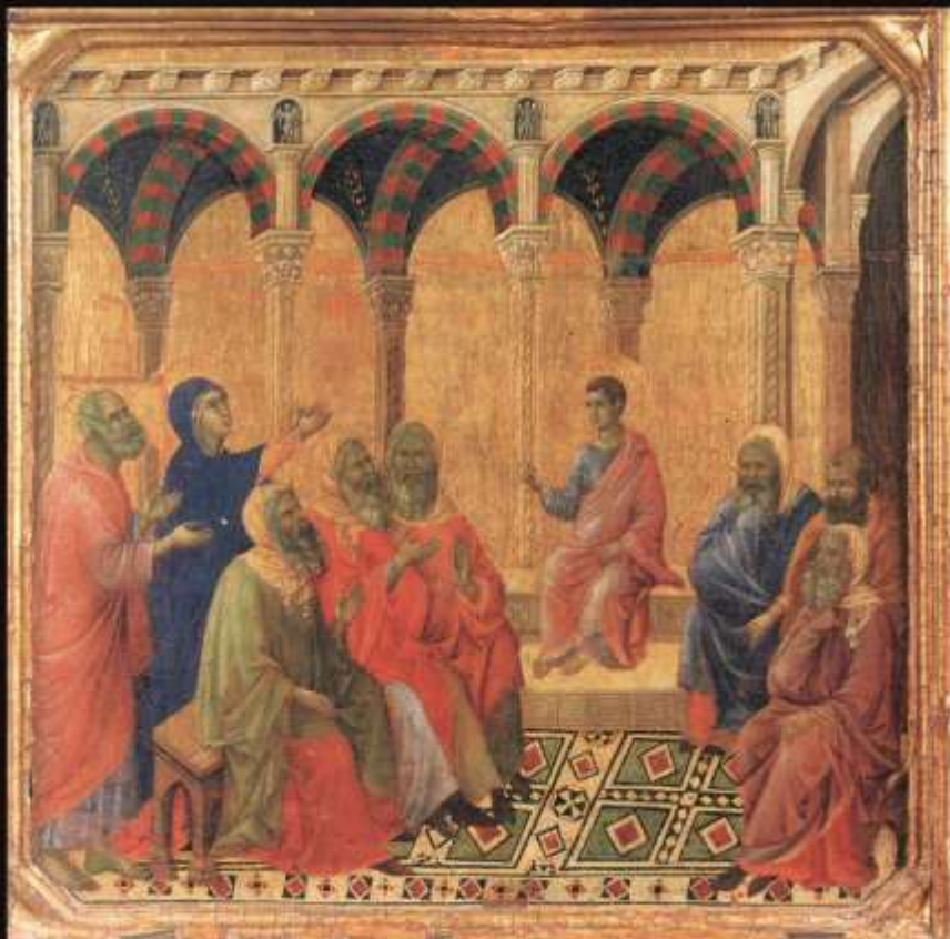
Отрок Иисус среди учителей. 1300г. Дуччо ди Буонинсенья. Италия.

Детство и отрочество Спаситель провел в Назарете. Престарелый Иосиф, плотник по профессии, обучил этому ремеслу и Иисуса. И Он, всемогущий Бог, ставший человеком, оказывал полное послушание и почтение Своим земным родителям. Каждый год Мария и Иосиф ходили на поклонение в Иерусалим в день Пасхи. Когда Отроку исполнилось 12 лет, Его взяли с собой. После окончания праздника все отправились домой, а Иисус остался в Иерусалиме. Родители не заметили этого, думая, что Он идет с другими их родственниками. Но когда стали искать и не нашли, то в тревоге вернулись обратно в Иерусалим. Целых три дня не могли они отыскать Его, не зная, что и думать, когда наконец нашли в храме. Он сидел посреди ученых мудрецов, слушая их и спрашивая, а те дивились Его разуму и ответам.