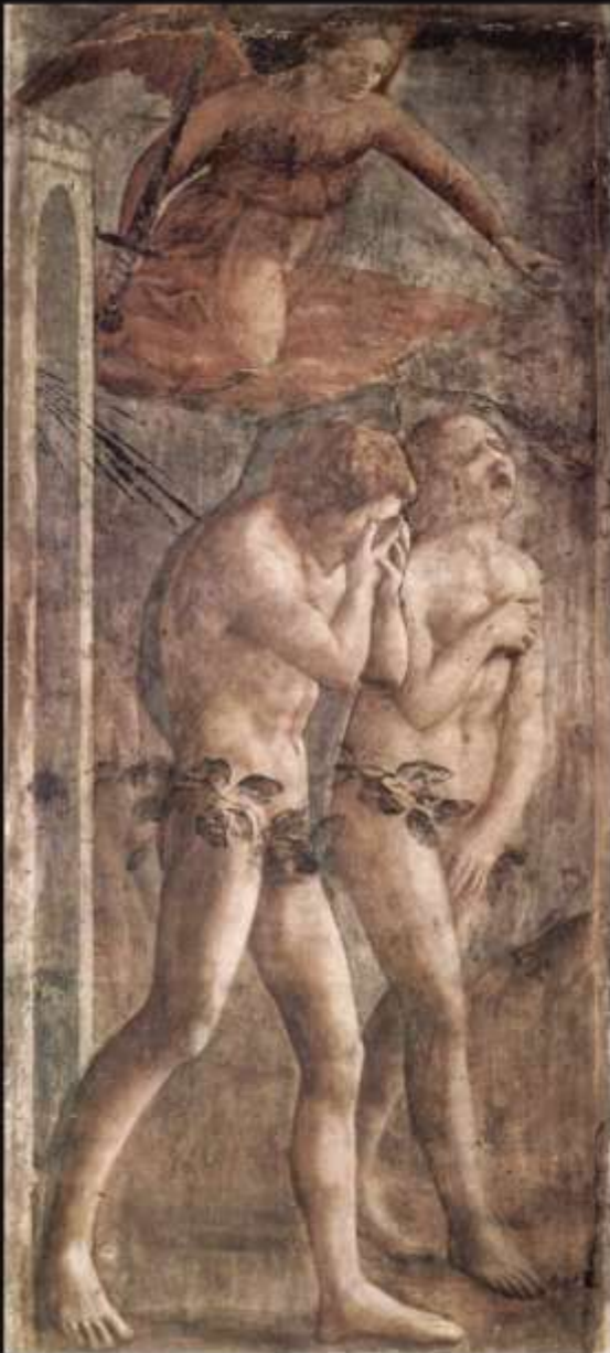
Изгнание из рая. Мазаччо. Флоренция, 1426 г. Фреска в капелле Санта Мария дель Кармине.