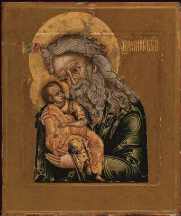
Симеон Богоприимец (Сретение). 1800г Россия. Москва XVIII в.

По предписаниям Иудейской религии, если в семье рождался первенец, то родители приносили за него жертву в храм. Для исполнения этого обряда Иосиф и Мария отправились в Иерусалим. В храме их встретил Симеон. Это был глубокий старик которому было предсказано, что он не умрет до тех пор, пока не увидит обещанного Спасителя. Симеон взял Его на руки и радостно молвил: «Ныне отпускаешь раба Твоего, Владыка...» Марии старец предсказал в будущем тяжелую скорбь.