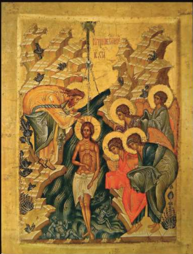
Крещение. 1497 г. Кирилло-Белозерский монастырь.

«Тогда приходит Иисус из Галилеи на Иордан к Иоанну креститься от него». (Св. Евангелие от Матфея 3:13)