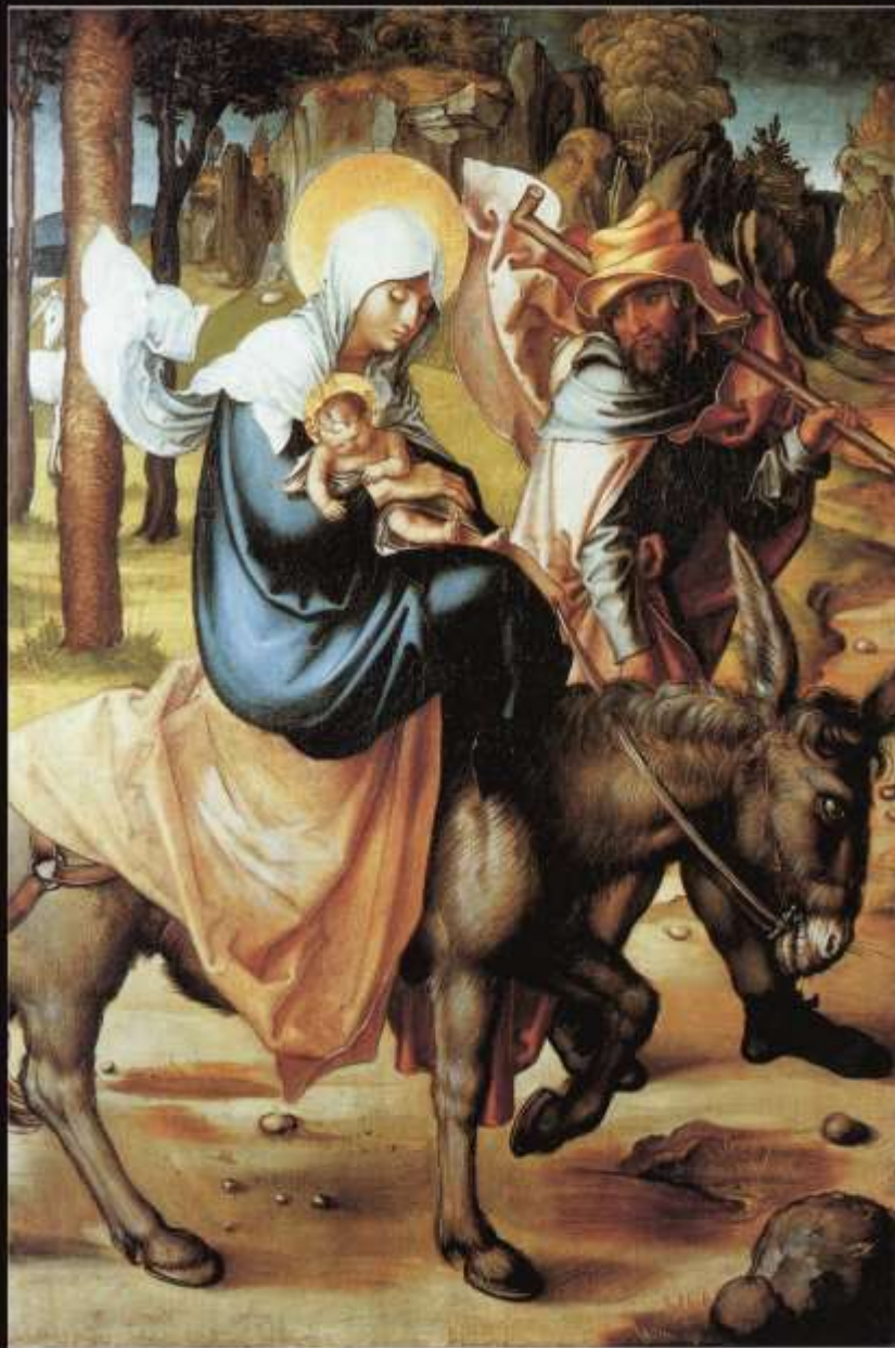
Бегство в Египет. 1497. Альбрехт Дюрер - немецкий график.