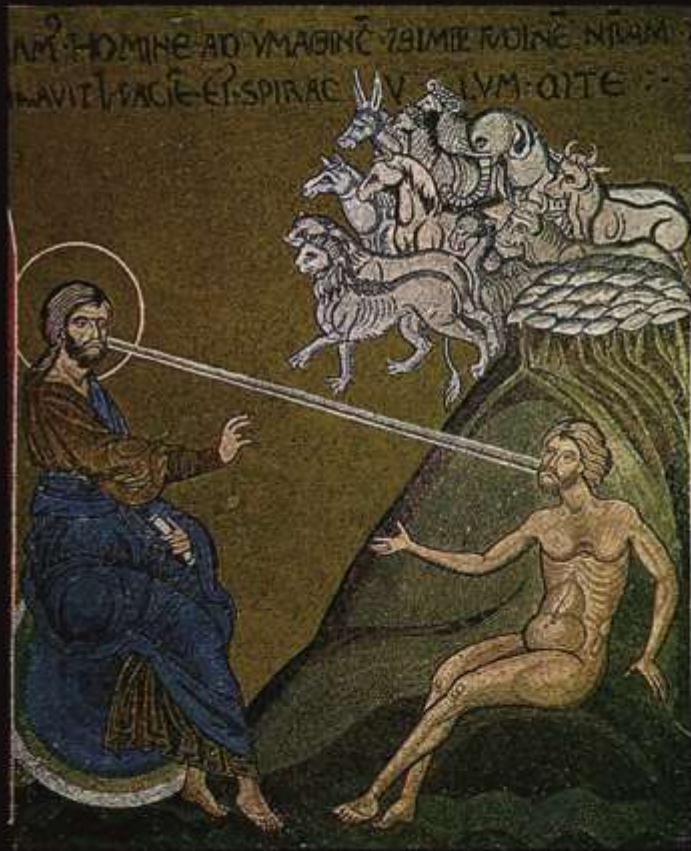
Сотворение Адама. Фрагмент мозаики собора Рождества Богородицы. Сицилия. Монреаль. XII в.

«И сказал Бог: сотворим человека по образу Нашему по подобию Нашему, и да владычествуют они над рыбами морскими, и над птицами небесными, и над скотом, и над всею землею». (Быт. 1:26)