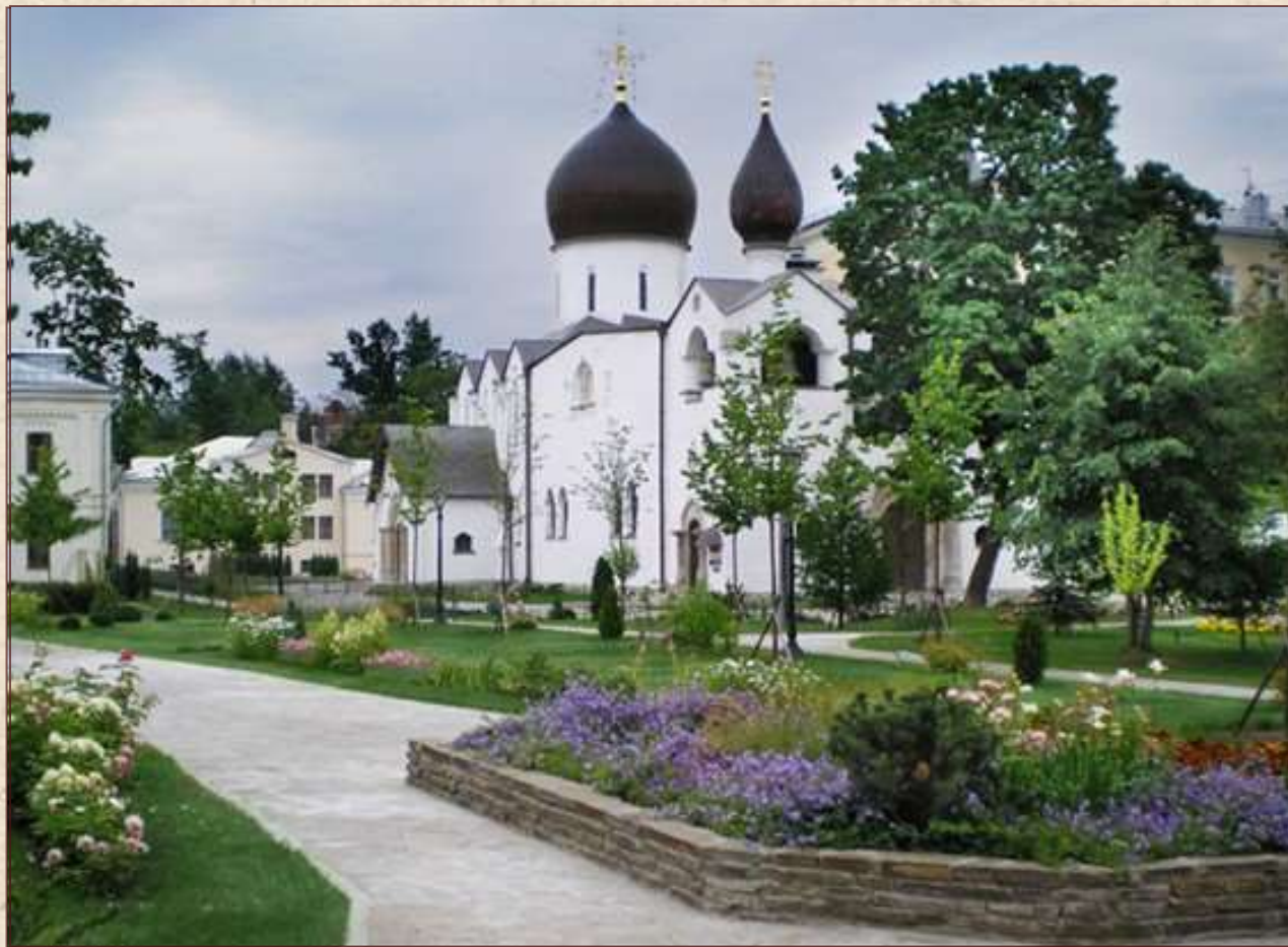
Русская Православная Церковь Московский патриархат